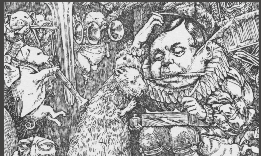
Ilustración de Henry Holliday para la primera edición