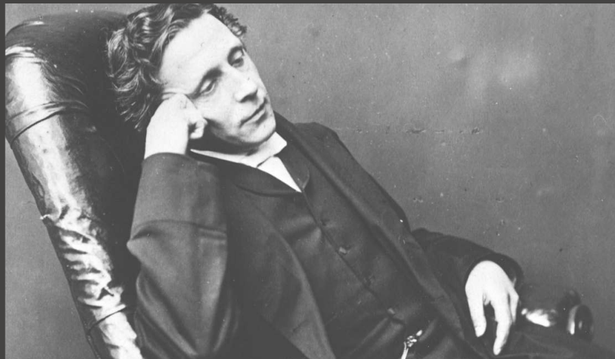
Lewis Carroll echando una siestecilla